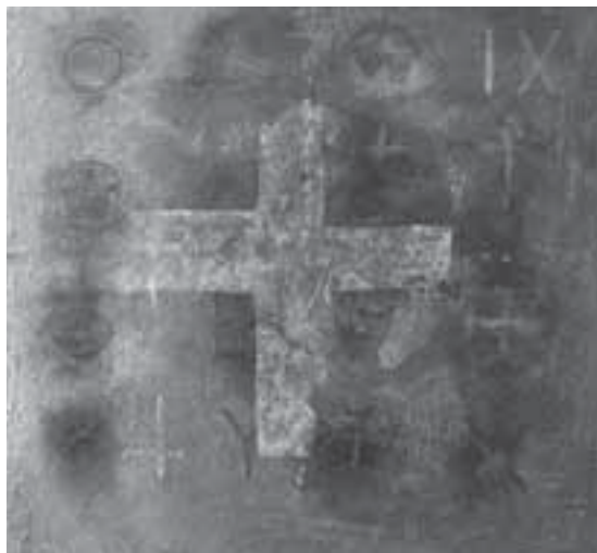
Assumpció Mateu (1952). La Creu. 2000. Mixta sobre fusta. 60x60 cm.

Més enllà de les consideracions que es puguin fer a l'entorn de la seva inauguració, caldrà presentar els seus objectius i les conclu-