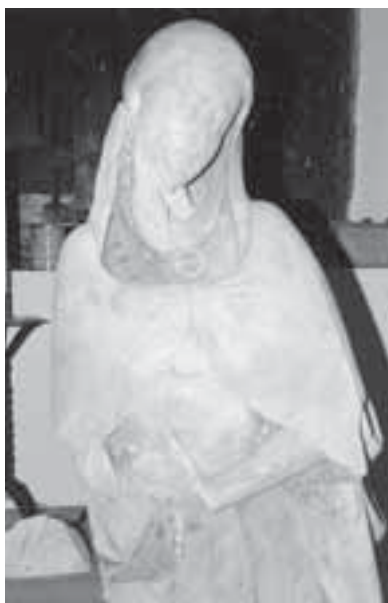
Detalls de fragments del conjunt d'alabastre.