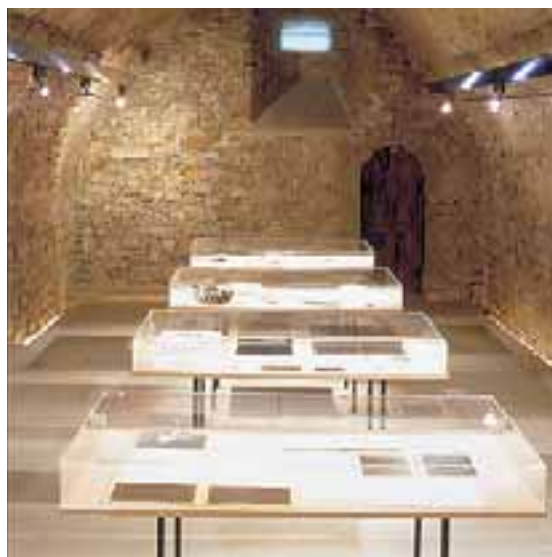
Detall d'una sala.

-L'albergueria, un espai retrobat: Presentà la recuperació de l'edifici de L'albergue-