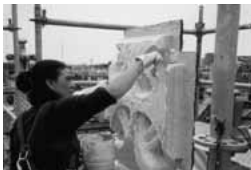
Motlles in situ