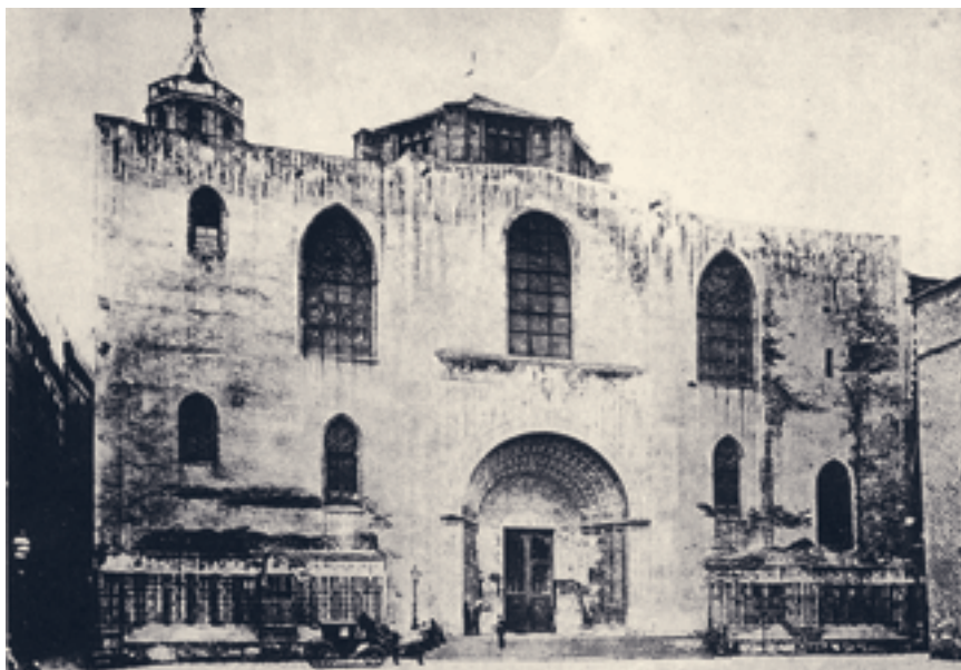
Façana catedral de Barcelona. 1458.

Hom observa el gran respecte que Rafael d'Amat i de Cortada, baró de Malda, tenia per les tradicions arrelades a la fe del nostre poble català. En elles, malgrat alguns defectes —com les romeries massa alegres del dilluns de Pasqua— excel·leix el convenciment que la Pasqua