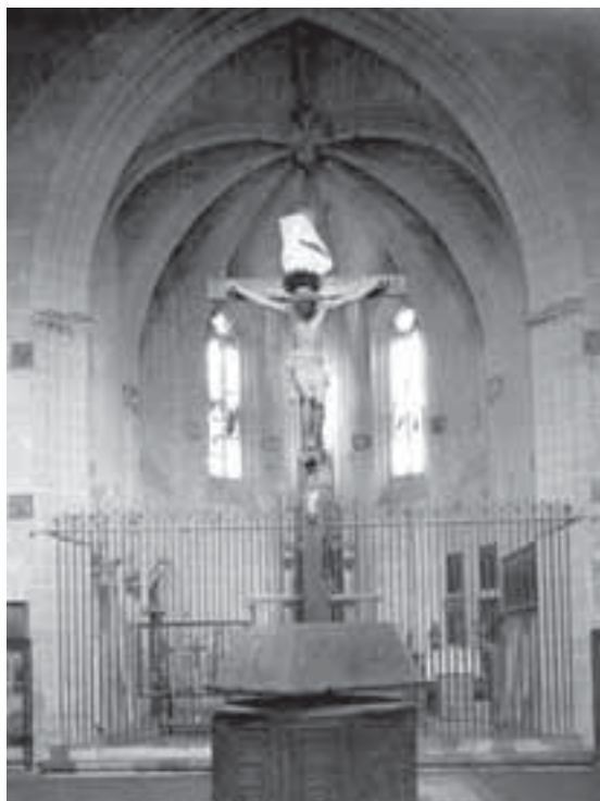
Sant Crist del faristol del Cor

també va llegar diferents objectes de culte, entre els quals hi havia una vitrina amb un Sant Crist d'alabastre amb la creu de banús que fou posada a la sagristia de l'altar de Sta. Tecla. És una imatge esposada sense creu en una vitrina de la sala capitular.