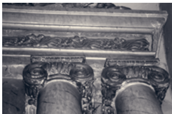
Altar de Sant Joan Baptista, detall de les columnes, capitells i entaulament. Església de Puig-gros, Bisbat de Lleida, s. XVIII. Guix daurat i policromat.