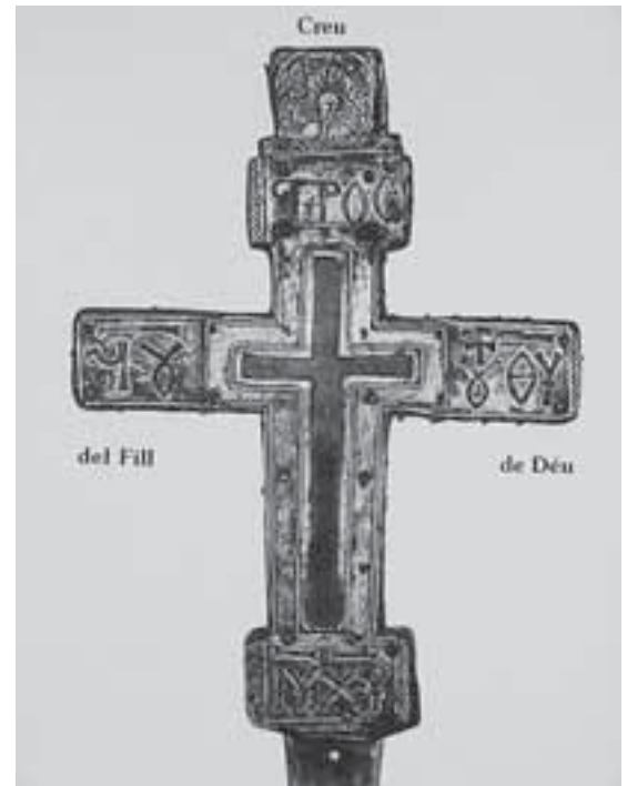
La Creu de Bagà.