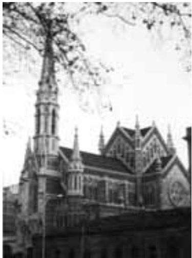
Les Saleses- Barcelona

Tel. 902 11 63 55 – Fax 93 421 25 49 – E- mail: grumanconst@retemail.es