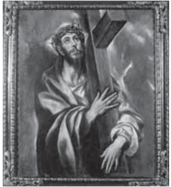
El Greco. Crist abraçat a la creu (1605 aprox.). Parròquia de Sant Esteve d'Olot.

El nombre d'obres d'art realitzades per artistes contemporanis ha estat important i ha obligat a fer-ne una tria representativa i que evidència que la religió cristiana es manté