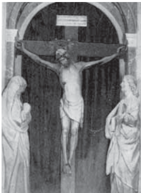
Sant Crist de la Salut.