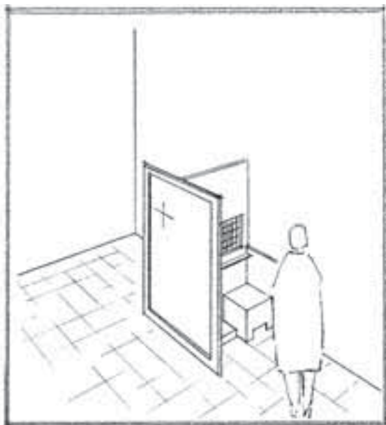
Confessionari senzill en angle.

discret (fàcil accés, confidencialitat...), un lloc autònom, però al mateix temps no aïllat, no independent ni del conjunt de l'edifici, ni del "corpus" més ampli al qual pertany (el conjunt dels sacraments amb el qual, d'alguna manera, ha d'estar en comunicació, si pot ser visible: obrir perspectives a l'altar eucarístic –cf. Ritual de Benediccions, 930-, al baptisteri...).