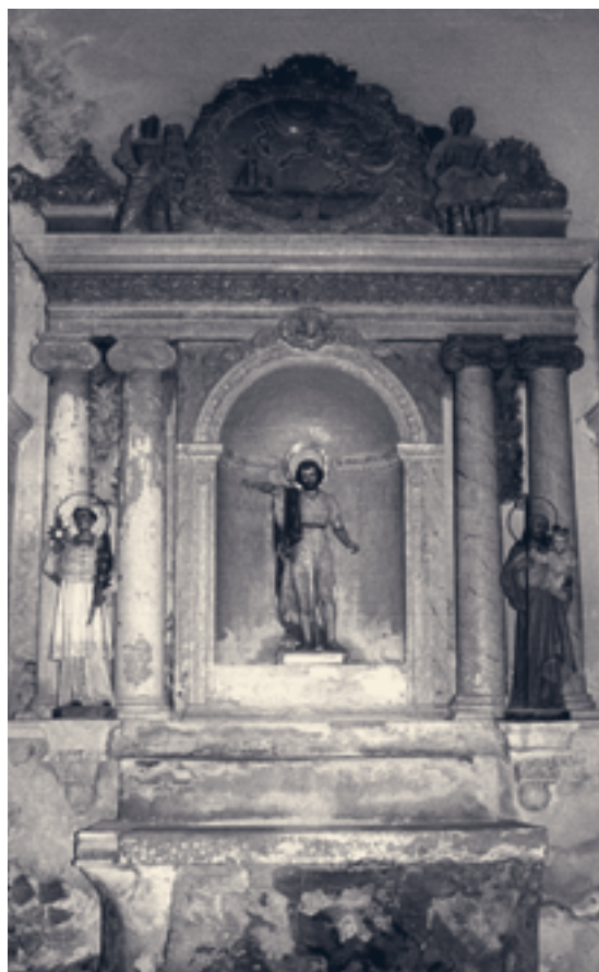
Altar de Sant Joan Baptista, església parroquial de Puig-gros, Bisbat de Lleida, s. XVIII. Guix daurat i policromat.

Alguns dels veïns que amablement ens van acompanyar en l'esmentada visita del propassat 6 de febrer estimaven de bona fe que potser fóra millor eliminar-los i netejar bé les esmentades capelles, però tan bon punt van escoltar els nostres raonaments van capgirar les seves idees i s'hi van posar a pensar