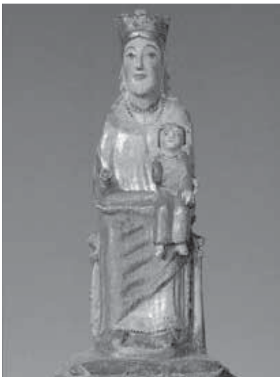
Mare de Déu d'Olp (Pallars Subirà) Segle XIII.

Tanmateix, i sense moure'ns del aspecte que estem analitzant, som ben conscients de les mancances del nostre Museu. Entre elles, la renovació dels rètols, la creació de l'escola de guies del Museu i la formació contínua del personal. Hem d'aprendre molt i ens queda un llarg camí per recórrer. Mirem, però, de tenir les idees clares i les fites ben marcades per tal de no defallir en l'esforç de cada dia, amb l'ajut de Déu.