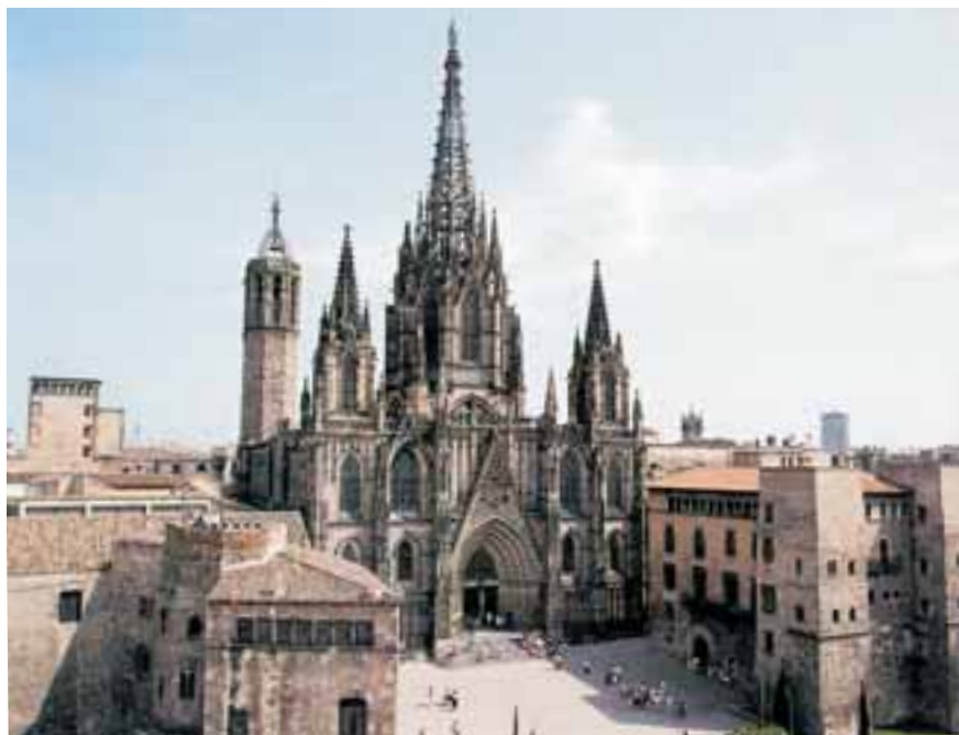
Façana catedral de Barcelona en l'actualitat.

florida era “la festa principal de l’any” Ho és ara? Per a l’Església sí que ho és, però per a la majoria de gent són simplement uns dies de vacances. Com podríem recuperar els trets