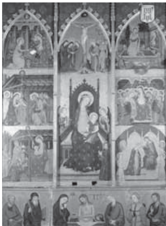
Retaule d'Abella de la Conca. Pere Serra, 1375.