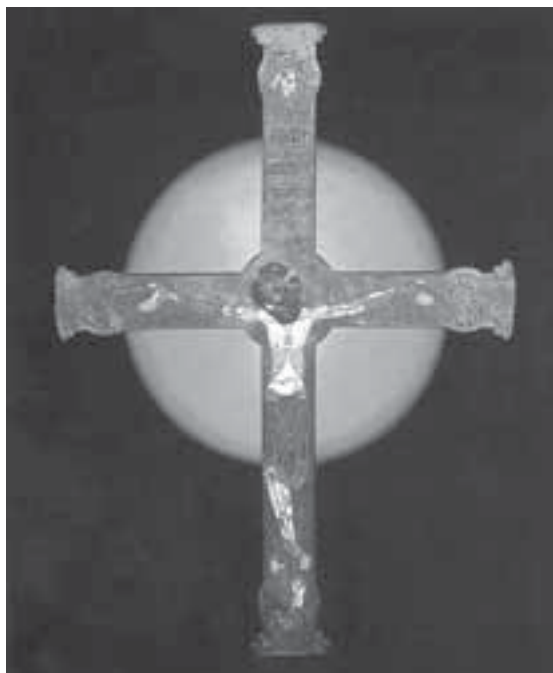
Crucifix amb esmalts. Catedral. SXII.

aquí, també, que Testimonio Editorial ens demanava de poder fer un facsímil amb tècniques ultramodernes. Nosaltres vam demanar a aquesta empresa, de poder oferir algunes miniatures del facsímil a la gran majoria de gent que no poden comprar la reproducció sencera del Beatus . Mentrestant, amb Mn. Marqués i Mn. M. Pal ja anàvem preparant un guió per a l'audio-visual i un fulletó catequètic, i a mi em bullia al cap la idea, que també em va suggerir el Sr. Bisbe, de publicar un llibre, més extens, que a més a més de fer un estudi del Beatus (del personatge i del pergamí), reproduís bellament totes les 86 miniatures, donant claus de lectura de cadascuna a l'home d'avui. Amb goig puc dir que aquest llibre, editat bellament per la mateixa Editorial que va fer el facsímil, és ja una realitat. La primera edició en castellà s'ha esgotat en quatre mesos i tenim ja l'edició en català, la segona en castellà. A principis d'estiu esperem tenir l'edició anglesa. Estan a l'abast de tothom al Museu Diocesà, Casa del Bisbat, 25700 La Seu d'Urgell.