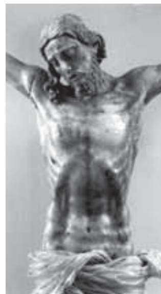
Esquerra: Sant Crist del Canonge Brufal. Dreta: Sant Crist del Canonge Ballester