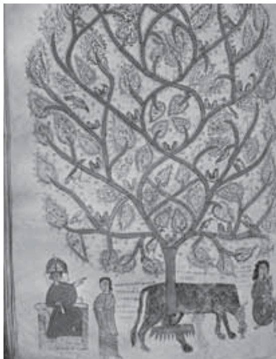
Beat de Liébana. S. XI. La visió de l'arbre.

Ens hem preguntat com fer conèixer més, per dins, el Beatus, és a dir el llibre de l'Apocalipsi i el seu missatge per a l'home d'avui. Quan bullien al nostre cap diverses idees (un audio-visual, un vídeo, un facsímil, unes làmines, un fulletó, una catequesi, o bé un llibre que reproduís i comentés totes les miniatures perquè poguessin parlar un llenguatge actual), fou precisament un periodista qui, en un article convincent, suggeria un bon audio-visual, i vet