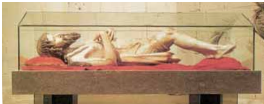
Crist Jacent. S. XIV Mestre Aloi. Parròquia de Sant Feliu. Girona.

És una escultura de tamany natural, peça central d’una composició amb les figures de la Verge, de les Santes dones, de Sant Joan i de Josep d’Arimatea i Nicodemus, tal com s’assenyala en el contracte de 5 de maig de 1350 en el qual fins i tot s’especifica la posició en el conjunt dels dos darrers personatges (Pere