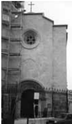
Sant Joan -Vilafranca